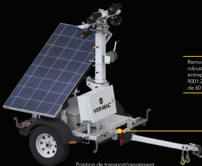
Position de transport/rangement

Remorque compacte et robuste fabriquée par une entreprise certifiée ISO 9001:2015 comptant plus de 60 ans d'expérience